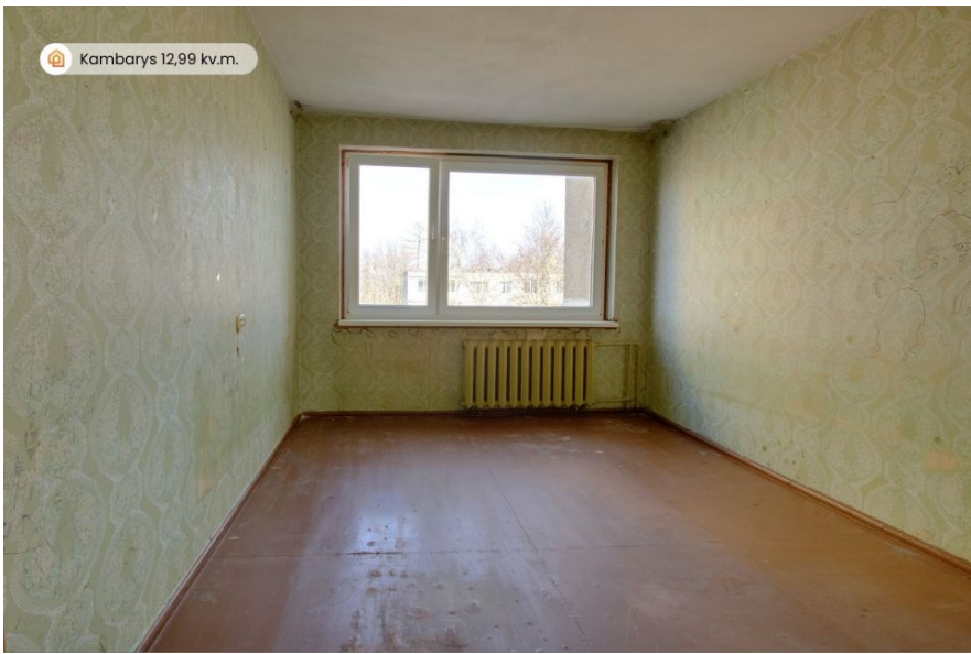
Kambarys 12,99 kv.m.