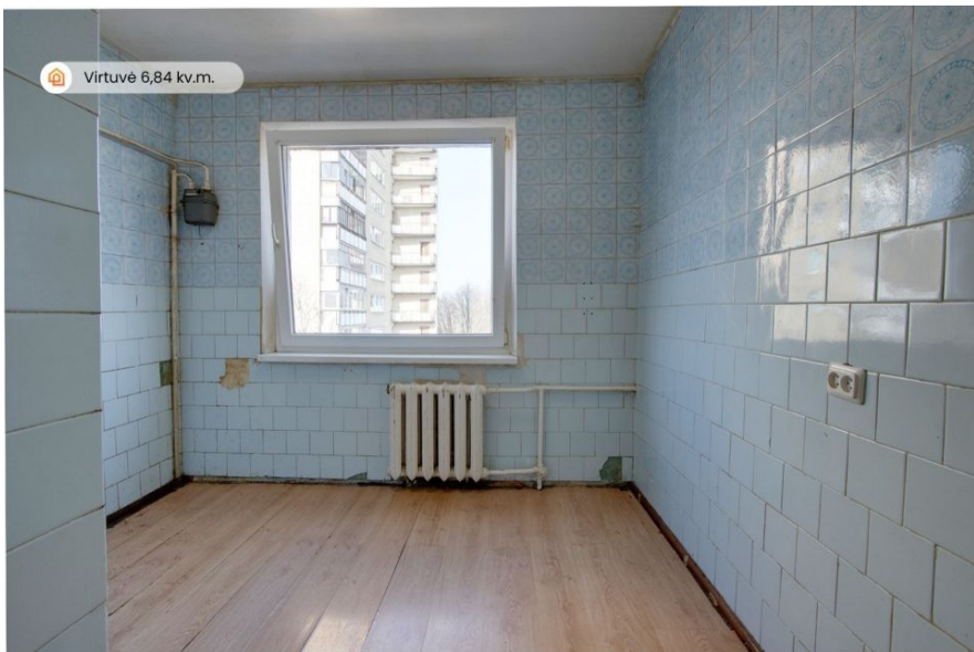
Virtuvė 6,84 kv.m.