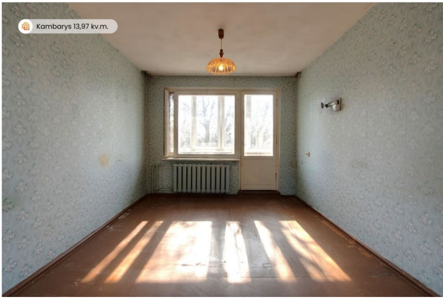
Kambarys 13,97 kv.m.