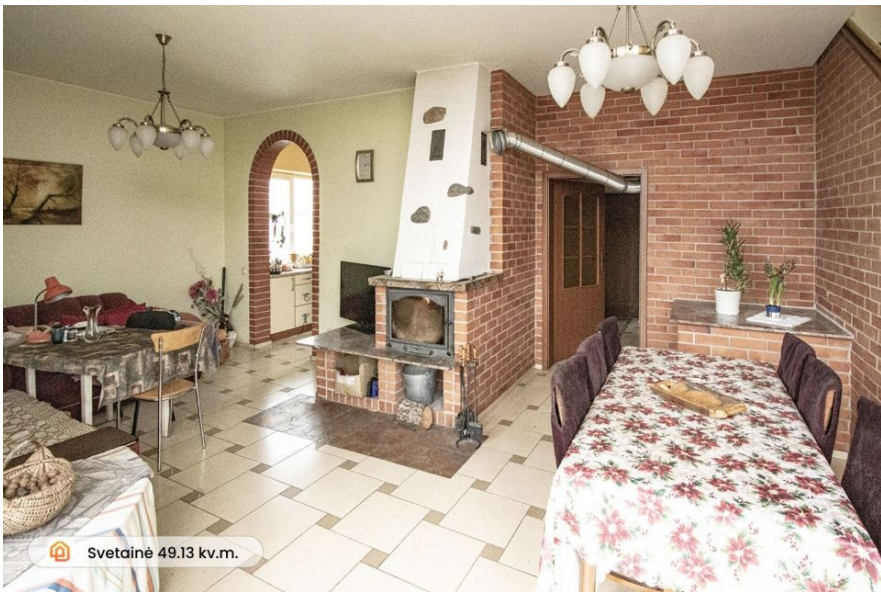
Svetainė 49.13 kv.m.