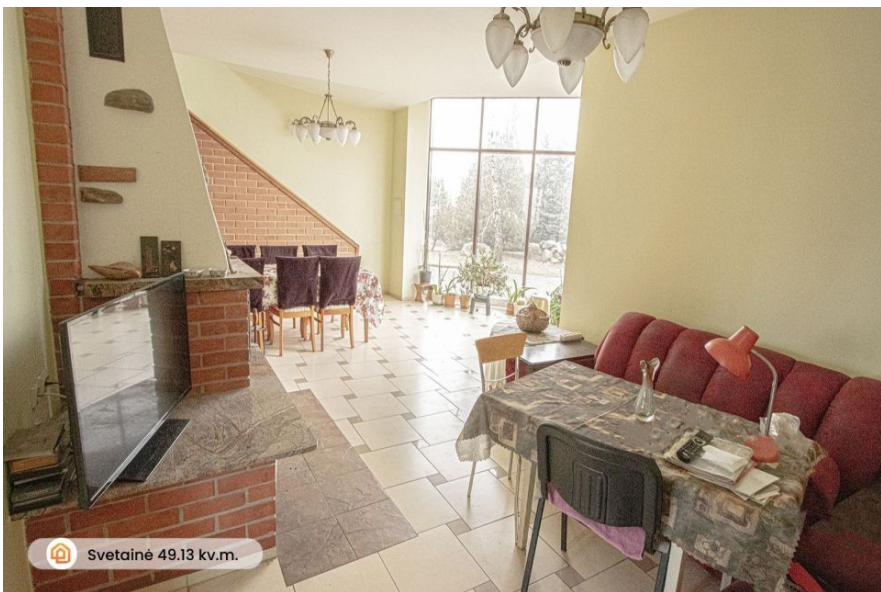
Svetainė 49.13 kv.m.