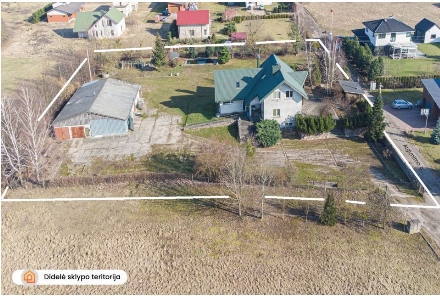
Didelė sklypo teritorija