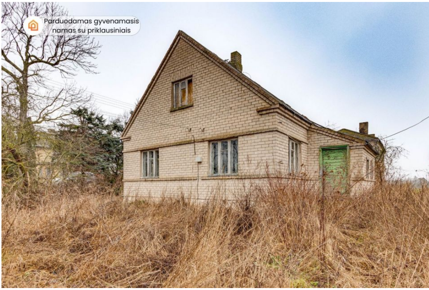
Parduodamas gyvenamasis namas su priklausiniais