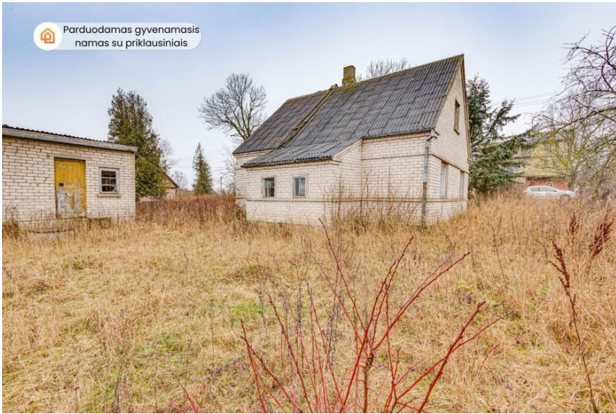
Parduodamas gyvenamasis namas su priklausiniais