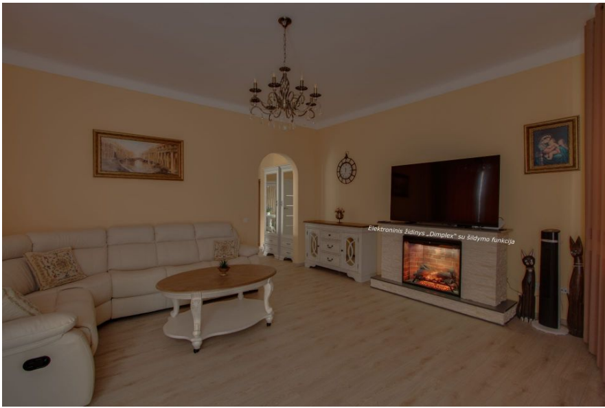
Elektroninis židinys „Dimplex“ su šildymo funkcija