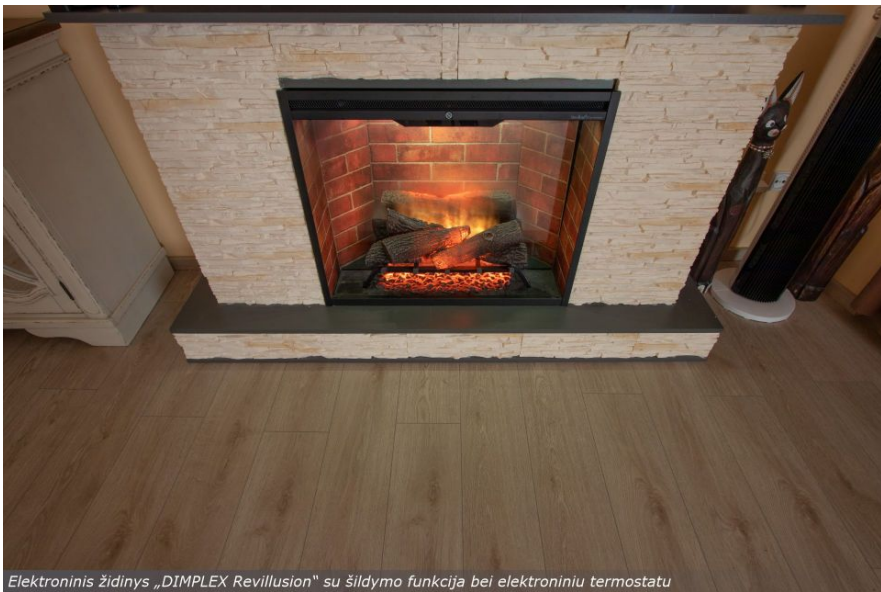
Elektroninis židinys „DIMPLEX Revillusion“ su šildymo funkcija bei elektroniniu termostatu