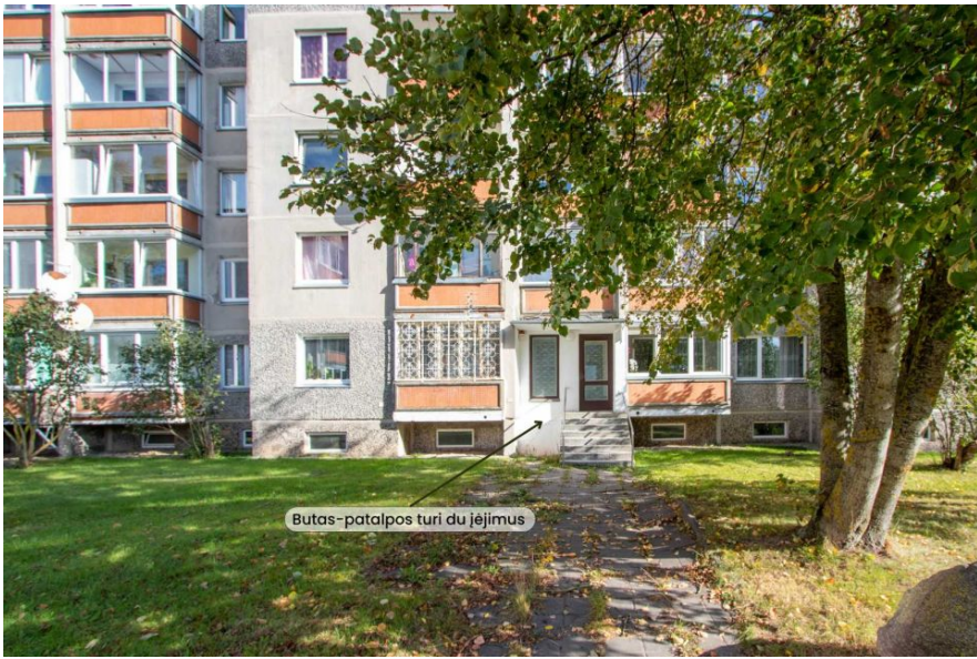
Būtas-patalpos turi du jējumus