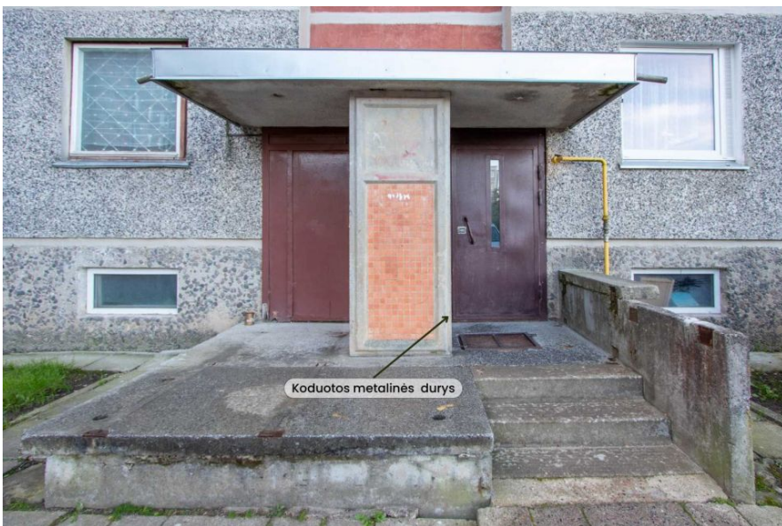
Koduotos metalinēs durys