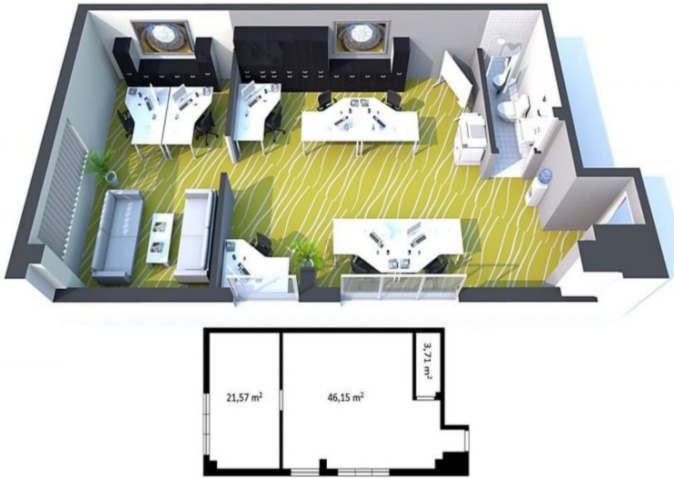
Patalpa 46,15 kv. m