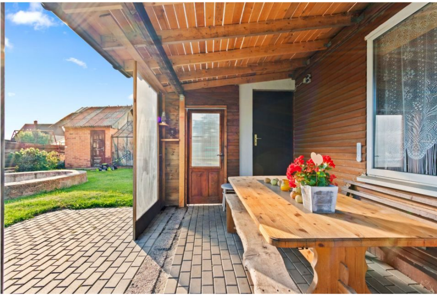
Parduodamas 2-iejų aukšto sodų namas