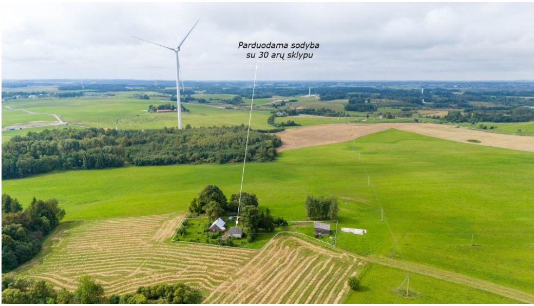
Parduodama sodyba su 30 arų sklypu