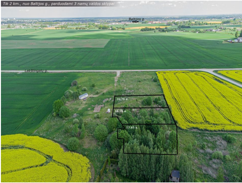
Tik 2 km., nuo Baltijos g., parduodami 3 namų valdos sklypai