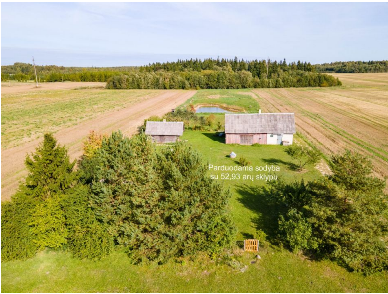
Parduodama sodyba su 52.93 arų sklypu