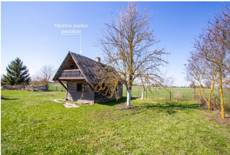
Medinis poilsio pastatas