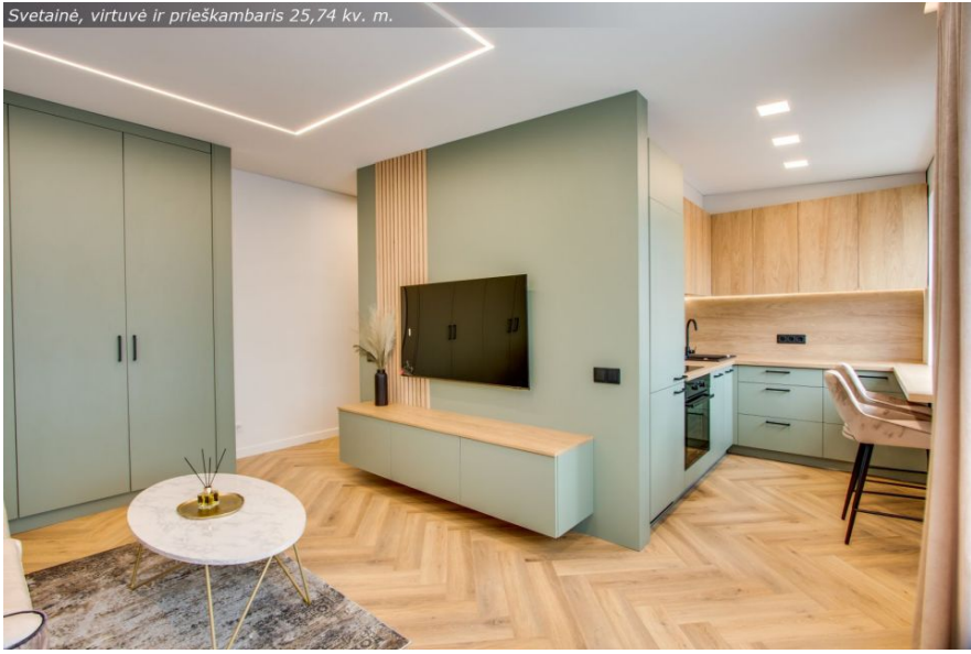
Svetainė, virtuvė ir prieškambaris 25,74 kv. m.