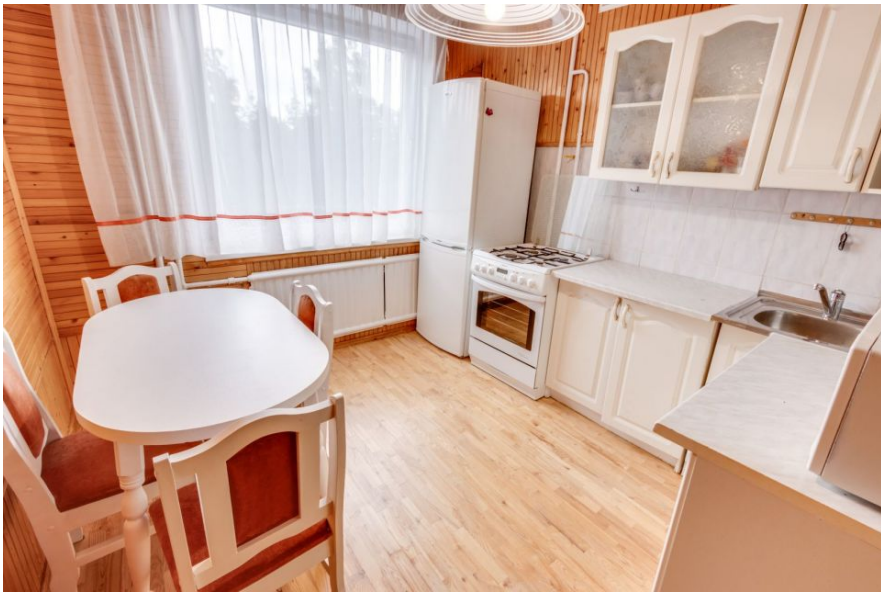
Virtuvě 9,46 kv. m.